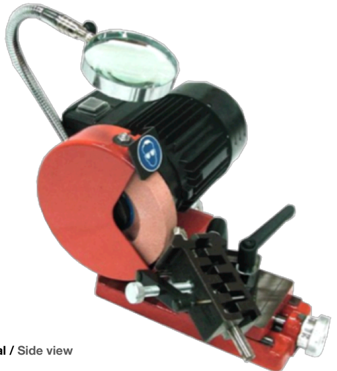
Vista lateral / Side view