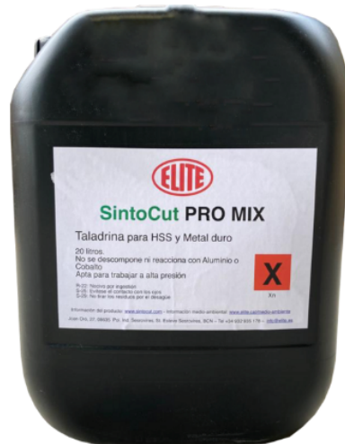
SintoCut PRO MIX 20 L

Recomendamos utilizar ELITE SintoCut MIX o equivalente cuando se trabaja solo con acero.