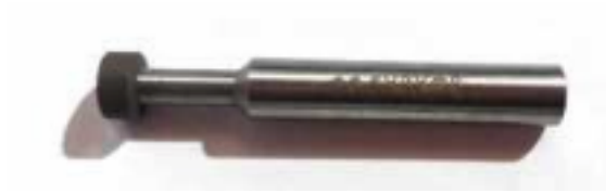
Pivote de diamante para dientes huecos