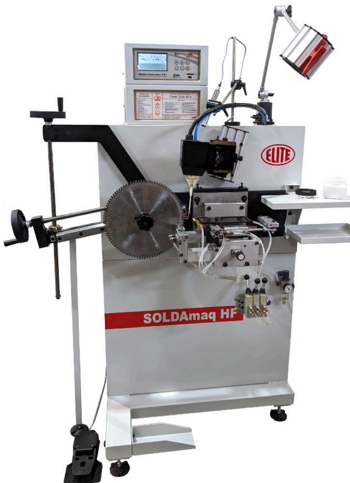
Versión con pirómetro / Version with pyrometer