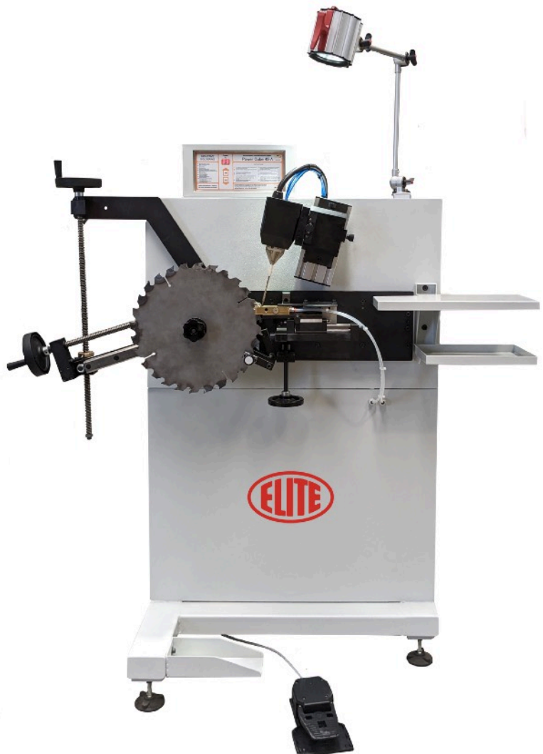
Versión básica / Basic version