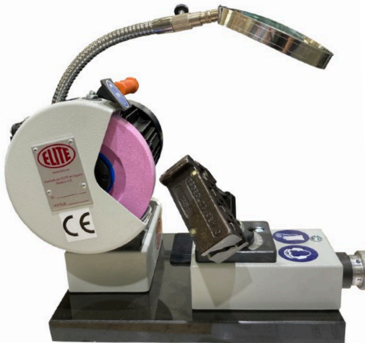
Vista lateral / Side view