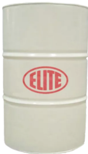
SintoCut PRO MIX en diferentes cantidades / in different quantities

Para metal duro o acero / HSS Oil emulsion to mix with water