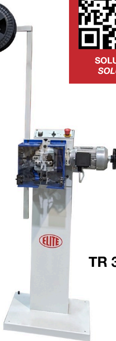
TR 3 AUTO

Para un excelente afilado de las sierras de cinta así como para su correcto mantenimiento y máxima durabilidad, recomendamos utilizar nuestra afiladora ELITE SC 2 o SC 3 y nuestra triscadora automática ELITE TR 3 AUTO